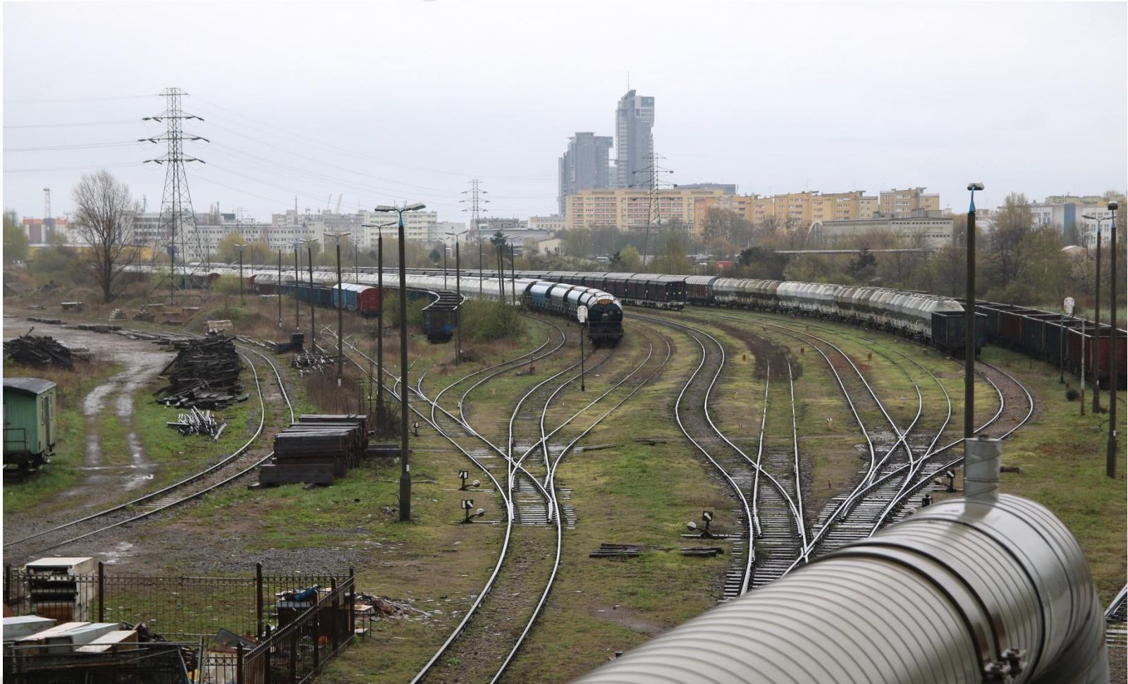
Stacja Gdynia Port – rejon P1