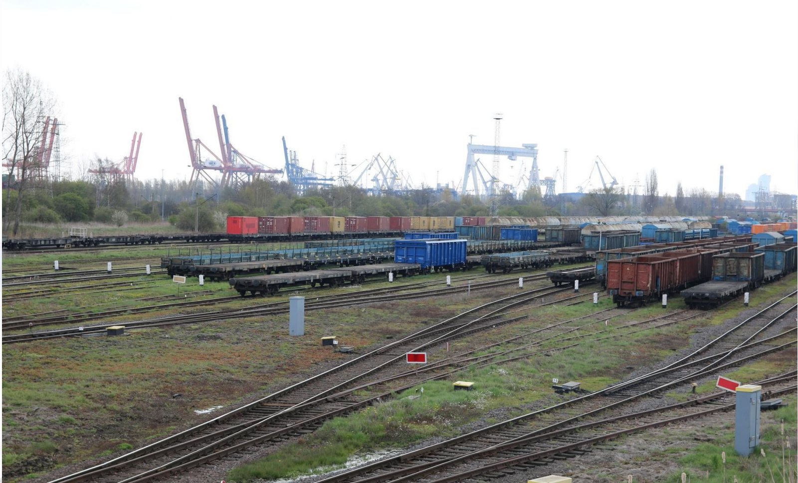
Stacja Gdynia Port – rejon GPA