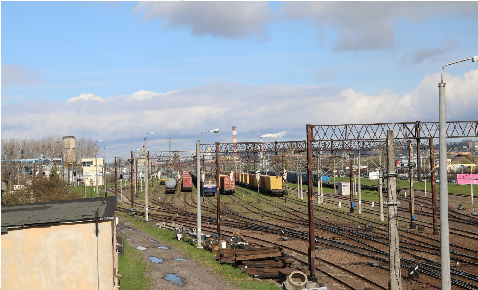
Stacja Gdynia Port – rejon GPA